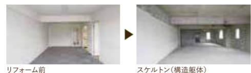
リフォーム前 スケルトン(構造躯体)